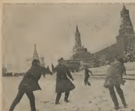
INVIERNO NA RUSIA Zwicklen y Finlandia a yegre Moscú - Na Bania, Noceñ Den kapital di Rusia riba e Rode Plein, i ser teñi e pro- me bungalowto cu accesor- hallen.